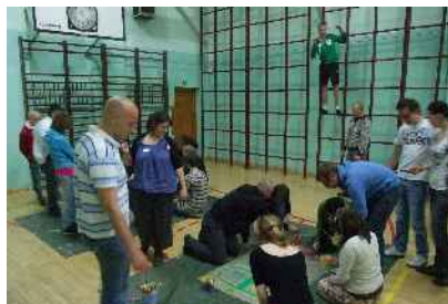
Integracja i warsztaty na temat wolontariatu