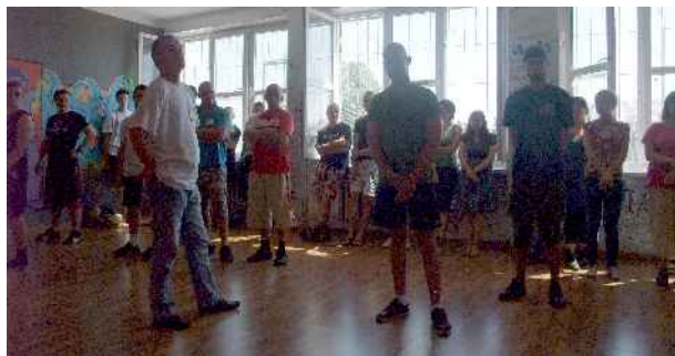
Warsztaty na temat wykluczenia, przygotowanie do festynu i debaty