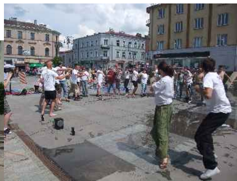
Happening na placu Artystów, a na koniec ścianka wspinaczkowa :)