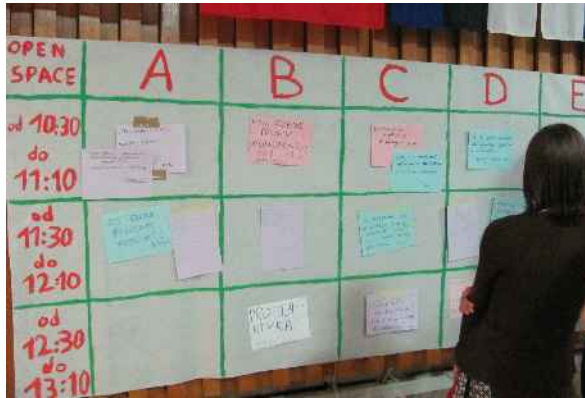
Tablica do tworzenia porządku debaty open space