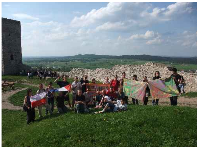
Wyprawa Górami Świętokrzyskimi do Chęciny