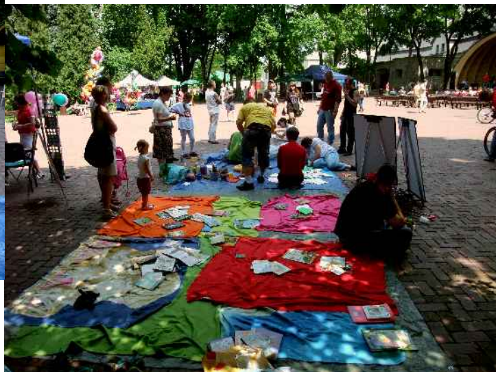
Animacje w ramach finału Świętokrzyskich Dni Profilaktyki - Zaaranżowane na tę okazję Biblioteki Podwórkowe